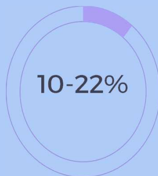
Alíquota do servidor

Percentual mensal descontado do salário, as contribuições dos segurados ativos, aposentados e pensionistas, possui alíquota progressiva conforme a Lei nº 3.441/2025 art.6º